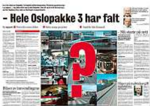
Oslopakke 3 slaktes i ny rapport, skrev Aften sist torsdag.