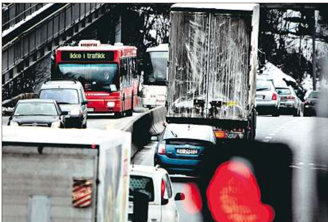
Både kollektivreisende og privatbilister skal få glede av prosjektene i Oslopakke 3, blant annet på Mosseveien. Nå er spørsmålet hvilke av de mange prosjektene som tas ut av planen.

– Det er ikke hensiktsmessig å vedta dette som en omfattende og detaljert tiltakspakke som løper 20 år frem i tid. Det er ikke urimelig å tenke seg at behovene vil endre seg underveis, og det er det uheldig å låse seg fast, sier Berntsen, som snarere anbefaler en trinnsvis opptrapping av planen utover i perioden, med revidering hvert 4. år. På den måten kan valg av hvilke investeringer man vil satse på og hvilke prisvirkemidler man vil ta i bruk justeres underveis.